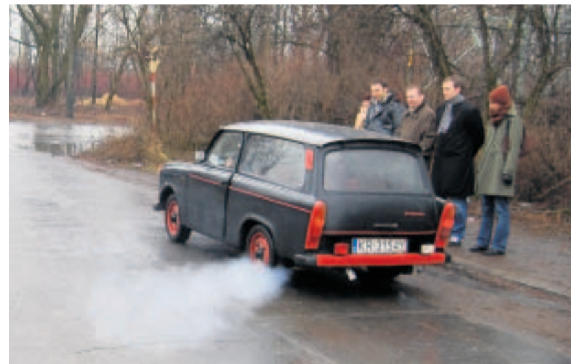
Sosialistinen nyrkkisääntö: mitä enemmän savua, sen paremmin menee.

ria. Kookkaimmassa kuvassa hymyilee puolalaisten suurin sankari, paavi Johannes Paavali II.