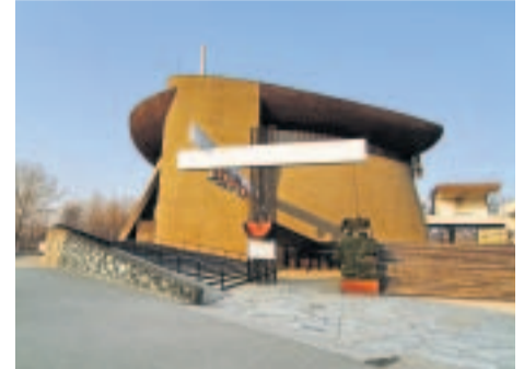
Asukkaat tappelivat itselleen kirkon. Vuonna 1977 vihityn Arkan eli arkin uskottiin purjehtivan kohti vapautta.