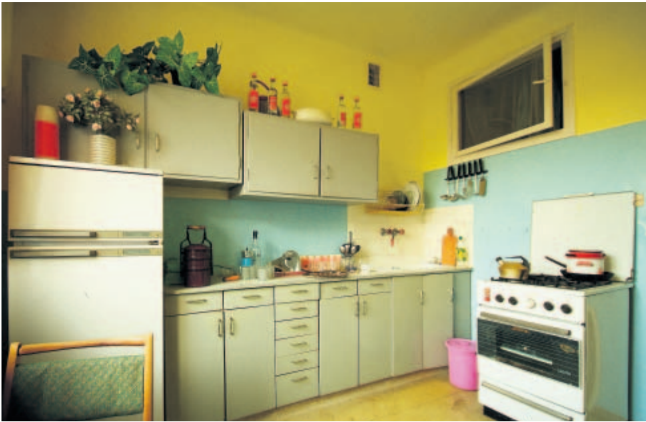
Stalinismin ja Solidaarisuuden kokenut keittiö.