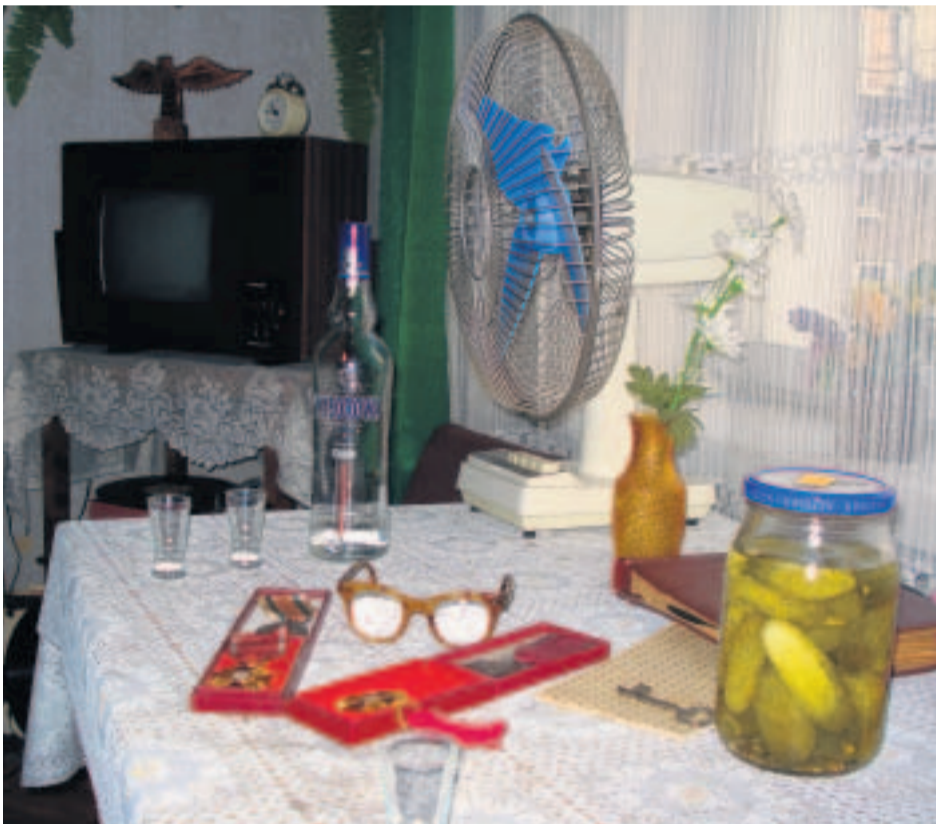
Näillä eväillä pärjää. Kotivarana Wyborowa-vodkaa ja suolakurkkuja.