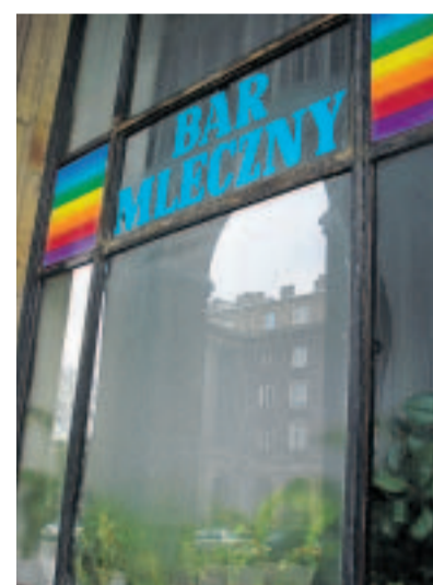
Maitobaarista saa yhä halpaa kotiruokaa.

– Tämä on Krakovan vihrein lähiö. Suurin osa asukkaista on eläkeläisiä, mutta