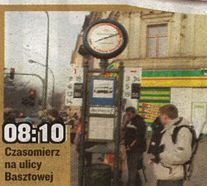
08:10 Czasomierz na ulicy Basztowej