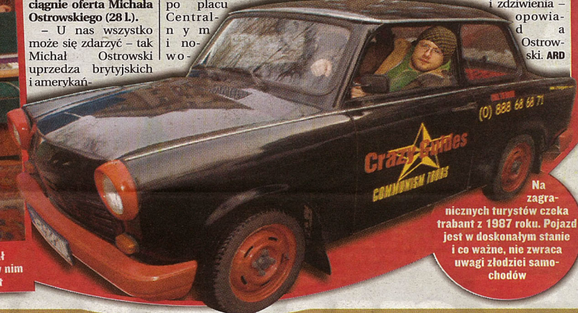
Na zagranicznych turystów czeka trabant z 1987 roku. Pojazd jest w doskonałym stanie i co ważne, nie zwraca uwagi złodziei samochodów