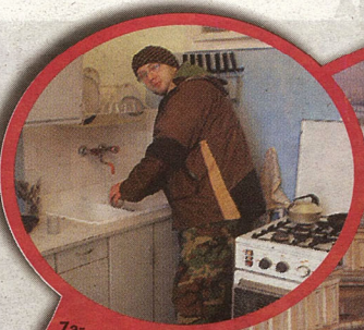
Zagraniczny biznesmen nie znajduje tu luksusów. Zobaczy za to ciekawy kran