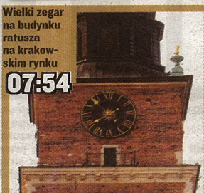
Wielki zegar na budynku ratusza na krakowskim rynku 07:54