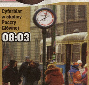
Cyferblat w okolicy Poczty Głównej 08:03